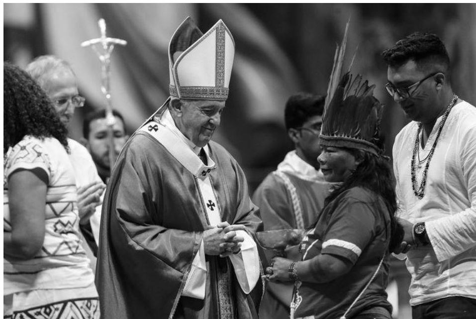
Paus Franciscus zondag bij de opening van de speciale synode over de Amazone in de Sint Pieter in Rome.

Franciscus deed zijn oproep zondag in Rome in zijn preek bij de opening van een speciale synode over de toekomst van de kerk in het Amazonegebied. Hij riep de unieke bisschoppenconferentie bijeen uit zorg over de verwoesting van het grootste regenwoud ter wereld en het onzekere lot van de inheemse bevolking.