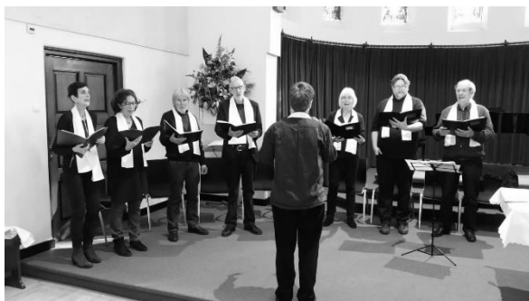
Het koor 'Veni Foras'